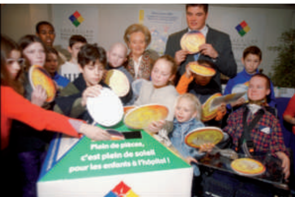
▲ Opération Pièces Jaunes, avec Bernadette Chirac et David Douillet, 2002.