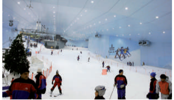
▲ Ski à Dubaï, la plus grande station dans le monde de ski d'intérieur, mars 2007.

2. Conjuguez les verbes au conditionnel passé.