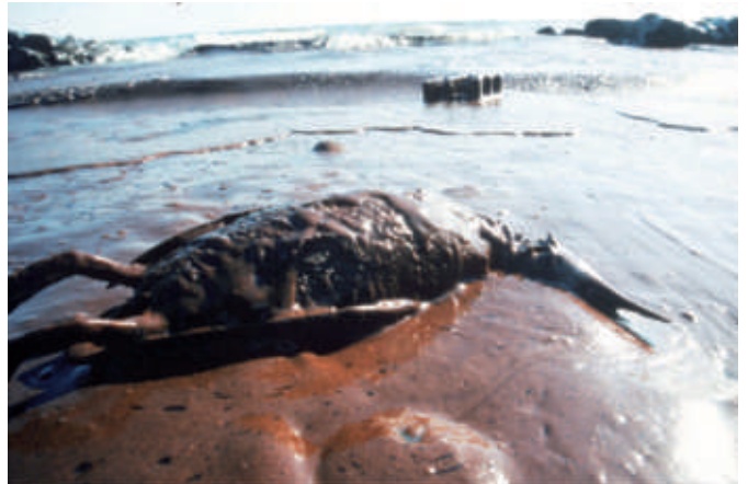
▲ 2) Oiseau recouvert de boue et de pétrole durant l'opération de nettoyage après la marée noire du Sea Empress , dans la baie de Carmarthen, Pays de Galles, Royaume-Uni, 1996.