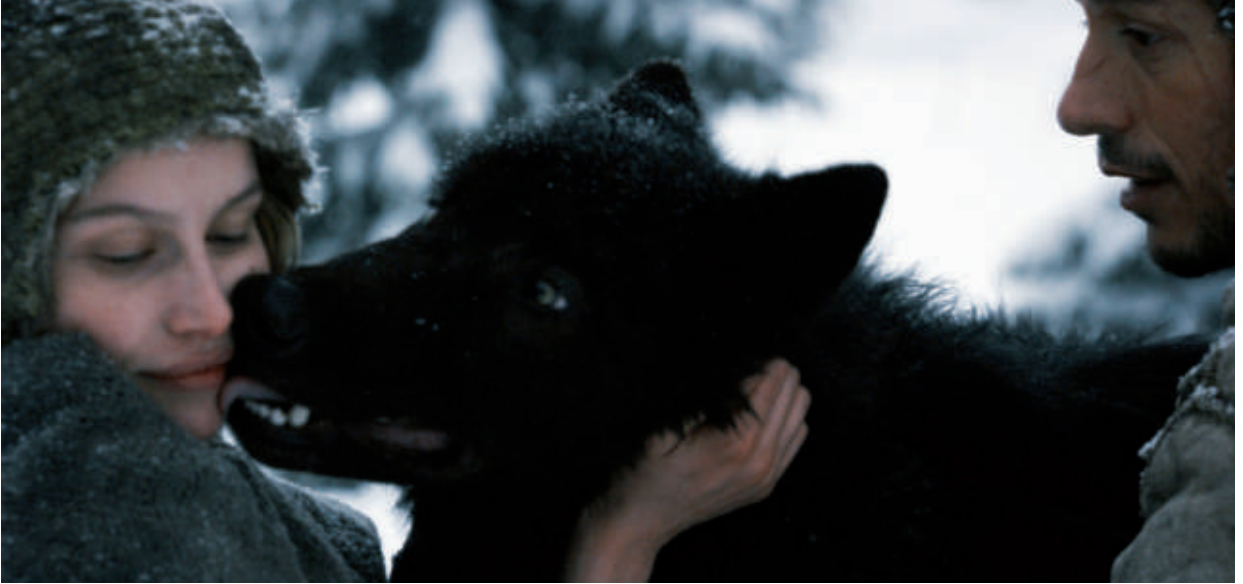
▲ La Jeune Fille et les Loups , film de Gilles Legrand (2008), avec Lætitia Casta et Stefano Accorsi.