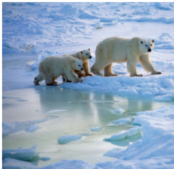
▲ Ours polaires.