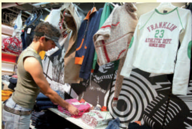
▲ Ouverture d'un espace de 4 000 m 2 aux Galeries Lafayette, dédié aux adolescents, Paris, septembre 2004.

50 c'est un peu court. On voit bien aussi, autour de la question des marques et des vêtements très coûteux, que certains n'hésitent pas à faire de gros profits sur le dos des ados. Ils ont bien compris que les enfants et les jeunes peuvent être exploités de cette manière-là. L'autre piège, c'est la tendance à habiller des petites filles en adolescentes. Comme s'il fallait raccourcir l'enfance pour accéder tout de suite à un univers de séduction sexuelle.