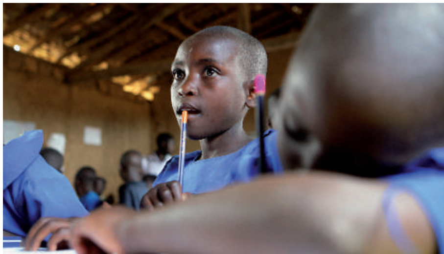
► Écoliers dans une école financée par l'UNICEF, Kigeyo, Rwanda, 2006.