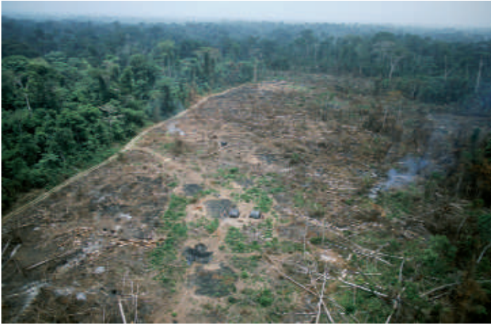
◀ 1) Déforestation dans la région de Yamoussoukro, Côte d'Ivoire, février 1998.