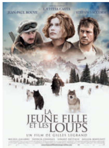
◀ La Jeune Fille et les Loups , affiche du film de Gilles Legrand (2008), avec Lætitia Casta, Jean-Paul Rouve et Stefano Accorsi.

→ La critique est aussi un exercice de style : le journaliste tente de séduire le lecteur en le sollicitant directement ou en jouant sur la connivence culturelle (les savoirs qu'il partage avec lui) ; il s'appuie aussi sur l' émotion (pour persuader) ou recourt à la distance ironique .