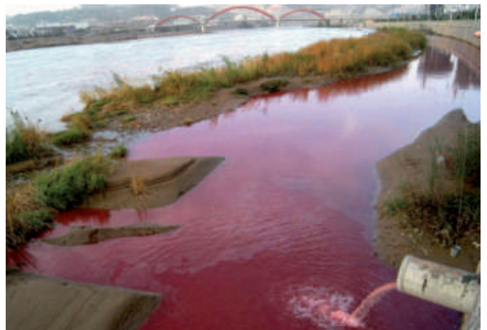
▶ 4) Une portion d'environ un kilomètre du Fleuve jaune (le deuxième plus long cours d'eau de Chine) est devenue rouge en raison de la pollution, octobre 2006.