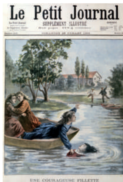
► « Une courageuse fillette » sauvant son amie de la noyade, couverture du Petit Journal du 28 juillet 1901.

Pour tous les extraits de Mon Quotidien et de L'Actu (p. 162 à 181 et p. 246 à 260) : © Mon Quotidien , le quotidien d'actualité dès 10 ans, © l'actu , le quotidien d'actualité dès 14 ans, www.playbac.fr