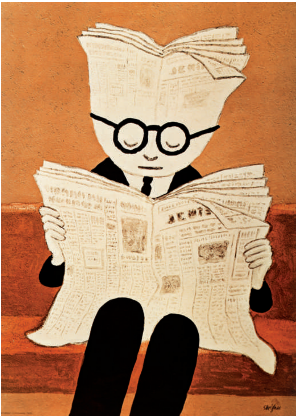
▲ Raymond Savignac (1907-2002), L'Information (1972), lithographie (collection privée).