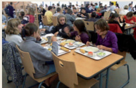
▲ Cafétéria dans une école en Angleterre, 2001.