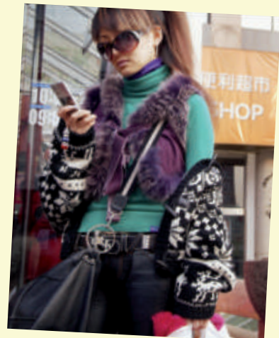
▲ Adolescente victime de la mode, Pékin, 2006.

Si on est scotché à son apparence comme si elle représentait toute notre personnalité, il y a un vrai problème. Comme si on ne pouvait pas 20 séparer l'être et le paraître. C'est important de garder un esprit critique et de l'humour par rapport à son look. C'est signe de bonne santé. Personne ne peut se résumer à sa seule apparence.