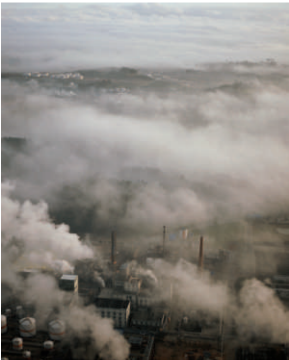
▲ 3) Usine et pollution, Sao Paulo, Brésil, décembre 2002.